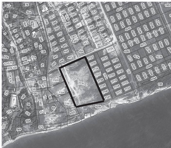
Схема границ территорий проекта внесения изменений в проект планировки территории Южной части города Новороссийска, утвержденный постановлением администрации муниципального образования город Новороссийск от 12 января 2012 года № 108 «Об утверждении проекта планировки Южной части города Новороссийска» с целью строительства объекта: «Объект гостиничного обслуживания на земельном участке с кадастровым номером 23:47:0118001:7716, расположенном по адресу: г. Новороссийск, в районе с. Мысхако» и разработке в составе проекта планировки территории проекта межевания территории

Условные обозначения: — - граница территории