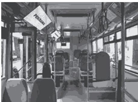
2.3. Рекламные места для размещения информационных установок для распространения видеорекламы и социальной рекламы.