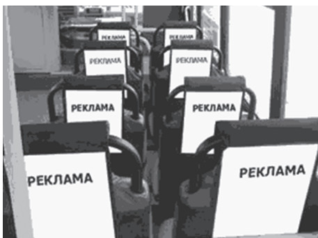
2.2. Рекламные места на внутрисалонных боковых конструкциях транспортного средства.