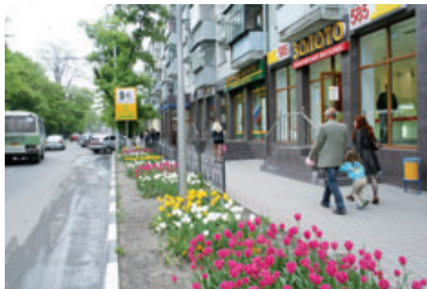
Торговые предприятия на ул. Советов

Утвержденный объем финансирования программы составляет 3 552 тыс. рублей.