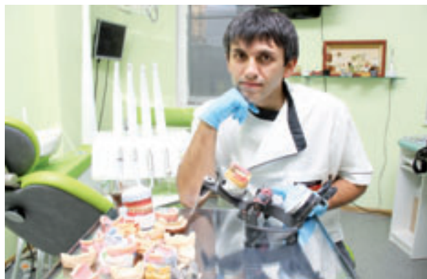
Немецкая стоматология в Новороссийске

За 2011 г. выполнено работ на общую сумму 203,7 млн. рублей, финансирование составило 190,1 млн. рублей, в том числе приобретено зданий на 36,2 млн. рублей (здание для размещения МБУ «Амбулатория №3» в ст. Натухаевской; помещение для МБУ «Городская поликлиника №2»). За 2010 год финансирование составило 144,26 млн. рублей, т.е. капиталовложения 2011 года выше уровня 2010 года почти в 1,3 раза.