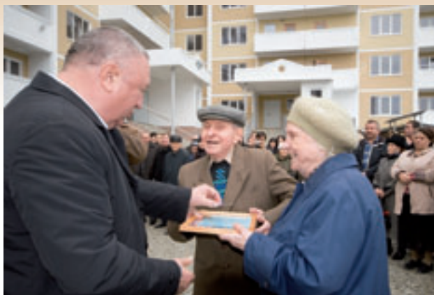
Ключи от новых квартир - ветеранам ВОВ