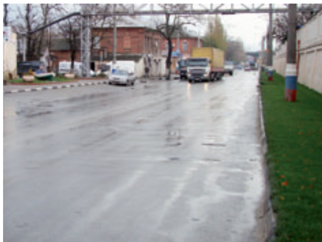
Новая автодорога города

Жилищный фонд города включает в себя 1134 многоквартирных дома. Общая площадь жилых помещений в них – 3 626,1 тыс. кв. м.