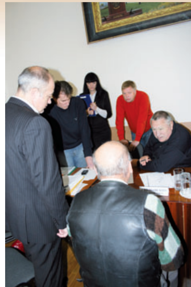
Глава города ведёт приём граждан

За отчетный год увеличилось количество телевизионных передач по общественно значимым темам с приглашением в студию представителей исполнительной и законодательной власти, общественных деятелей, экспертов. Продолжалась работа по повышению оперативности и информационной насыщенности городских газет. Примером такой работы может служить успешная реализация муниципальной газетой «Вечерка. Вечерний Новороссийск» общественно значимого проекта «Прописные истины», получившего высокую оценку читательской аудитории.