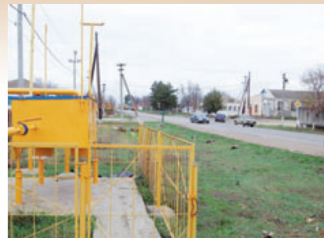
Оборудование сетей района

Установлено 105 лавочек, 2 туалета, 103 урны, заменено 7 остановочных павильонов, отремонтировано 33 контейнерных площадки.