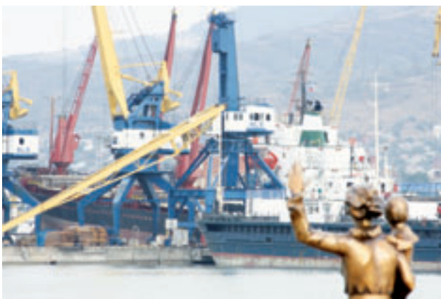
Благоустройство и озеленение города

■ на профобучение – 143 человека (за соответствующий период 2010 года – 174 человека);