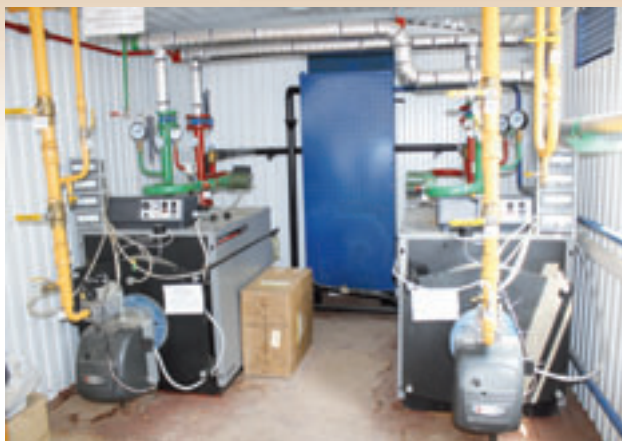
Новое отопительное оборудование

- С 4 по 6 декабря я лежала в кардиологии МУЗ «Больница №3». Никогда раньше такого не было: едешь в больницу, а попадаешь в санаторий. Все очень чисто, ремонт прекрасный везде, питание замечательное. Внимательный персонал, лечение отличное. Наверное, такой и должна быть настоящая медпомощь!