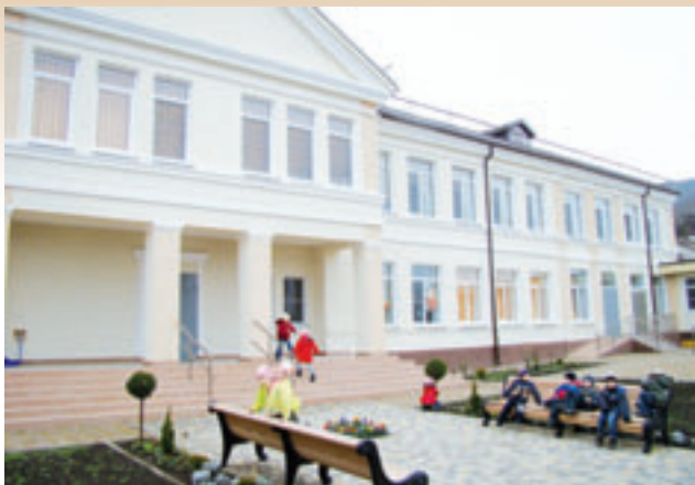
Отремонтированный детский сад

■ дороги местного значения городского округа – 603,6 км.