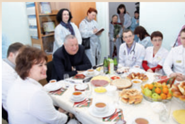
Вручение ключей от квартир специалистам сосудистого центра

риальное стимулирование медицинских работников учреждений здравоохранения, оказывающих амбулаторную медицинскую помощь, и обеспечение лекарственными препаратами и расходными материалами, необходимыми для проведения диагностических и лечебных мероприятий при оказании амбулаторной медицинской помощи. В результате реализации данного мероприятия учреждениями здравоохранения получено 18 845,2 тыс. рублей.