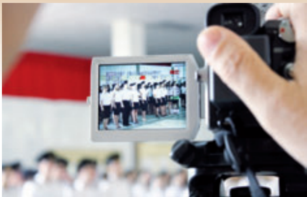
Построение курсантов МГА