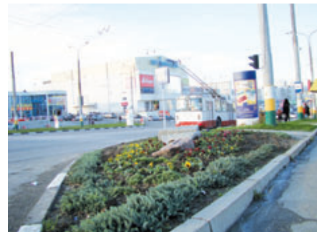
Благоустройство Южного внутригородского района