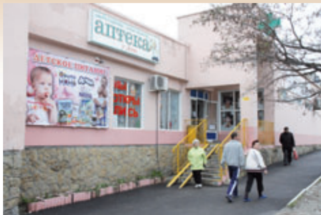
Новая аптека на Мефодиевской