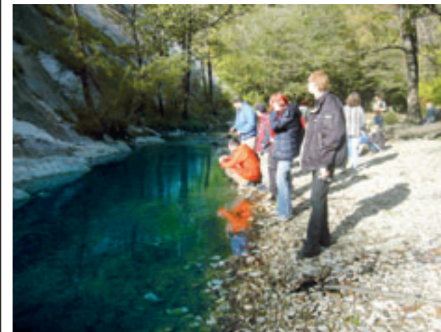
Туристический поход в окрестности города

В 2011 году был открыт Новоросийский волонтерский центр, на базе Новоросийского колледжа строительства и экономики. На организацию его деятельности из городского бюджета было выделено 350 тыс. рублей.