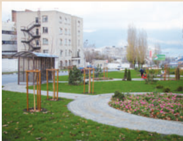
Благоустройство Южного внутригородского района

В 2011 году в районе выполнено благоустройство 113 дворов.