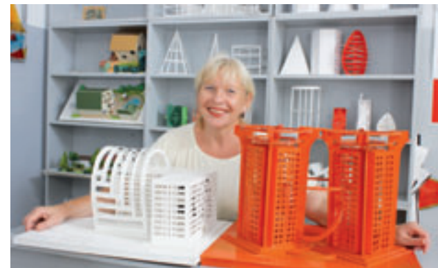
В художественной школе города

Третий год в городе проводится фестиваль-конкурс «Новороссийск – читающий город». В 2011 году при ЦГБ им. Горького открыт отдел «Молодежный про-