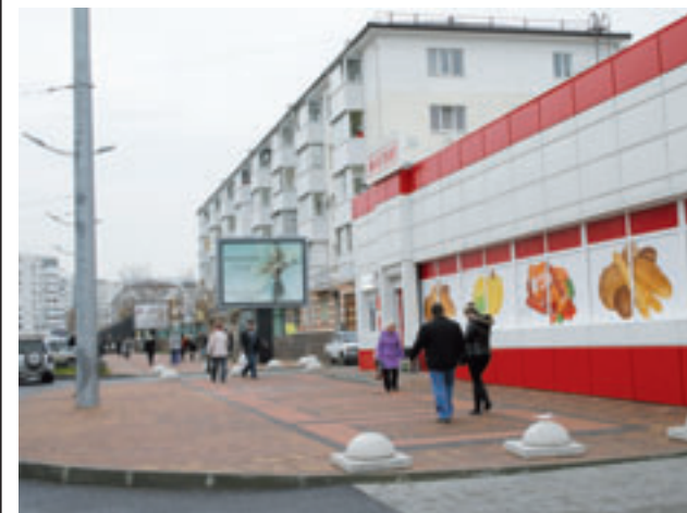
Зона магазинов на пр. Ленина

В 2011 году в структуре бытовых услуг наиболее значительный удельный вес занимают ремонт и техническое обслуживание бытовой радиотехники – 80,1 %, ремонт и строительство жилья – 3,7 %, услуги бань и душевых – 7,2 %, услуги парикмахерских – 2,7%, все остальные виды услуг – 6,3 %.