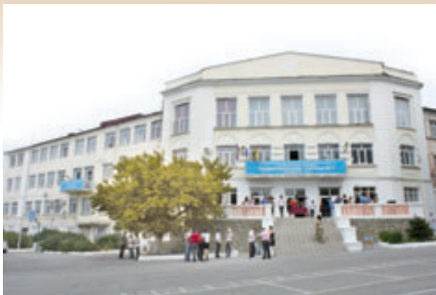
Ремонт учебных заведений

были организованы курсы повышения квалификации в рамках реализации новых федеральных государственных стандартов, которые прошли 162 человека. Из них: 133 учителя, 18 директоров, 11 заместителей директоров.