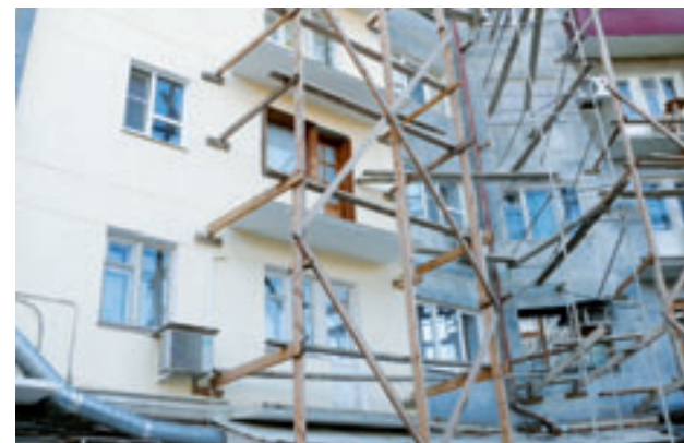
Ремонт дома на ул. Толстого

Указанные полномочия охватывают широкий круг вопросов функционирования городского хозяйства и социальной сферы, в том числе: содержание и благоустройство территории района, организацию работы предприятий для проведения санитарной очистки закрепленных за ними территорий, утилизации и переработки бытовых отходов; организацию торгового и бытового обслуживания населения, создание благоприятных условий для работы учреждений культуры и спорта, образования, здравоохранения, органов территориального общественного самоуправления и общественных объединений, организации работы с населением и, прежде всего, с детьми и молодежью по месту жительства; вопросы опеки и попечительства, работы с ветеранами, пенсионерами, инвалидами и другими категориями граждан.