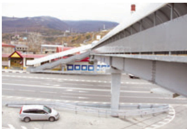
Промышленный район Новороссийска

Розничный товарооборот по крупным и средним предприятиям (без учёта оборота малого предпринимательства) возрос на 533,0 млн. рублей или 8,1% отно-