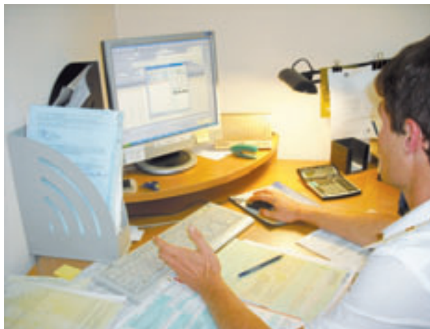
Момент работы МФЦ

Членами и экспертами Общественной палаты были проведены комиссионные проверки розничных цен на отдельные лекарственные средства в аптеках города,