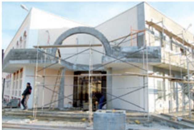
Строительный объект Новороссийска

Рост объёмов отгруженной продукции отмечен в 8-