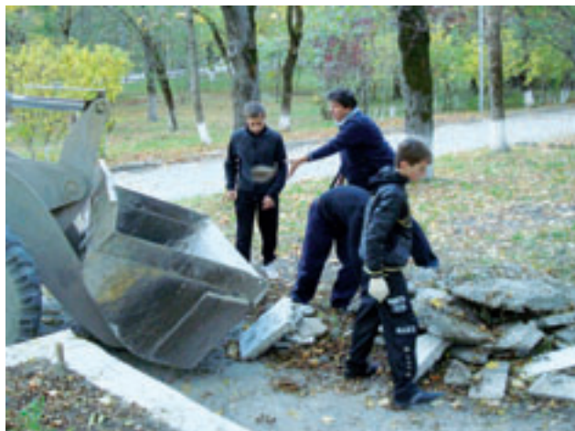
Субботник в с. Гайдуке

Объем финансирования составил 8 300 тыс. рублей.